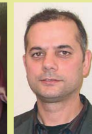
Cem Organ Integrationsrat