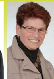
Lieselotte Wallerich Bündnis 90/Die Grünen